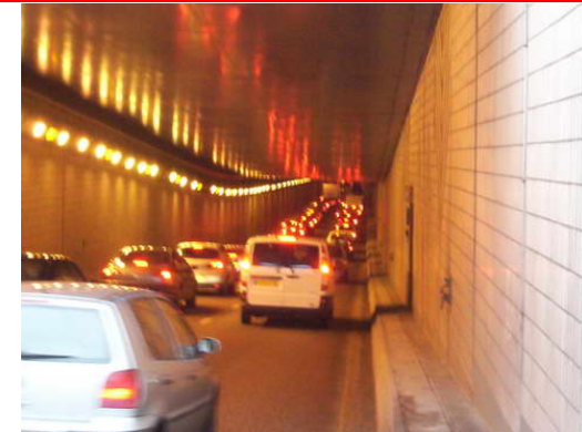
Le tunnel de Javel = 4 voies saturées