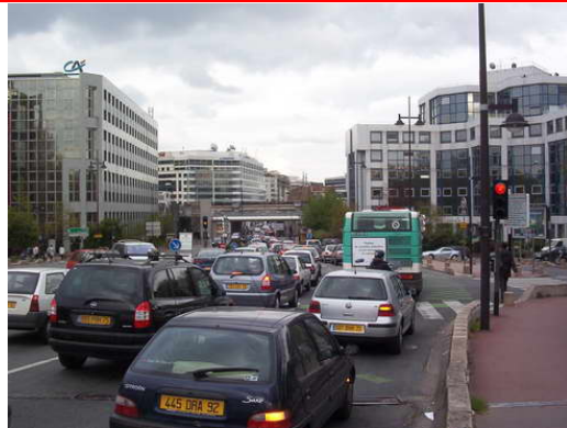
Pont d'Issy vers Issy-Centre = 6 voies saturées !!!!