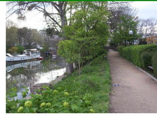
Devant la déchetterie d'ISSY et en aval, face aux Iles St Germain et Seguin : des cheminements à ennoblir